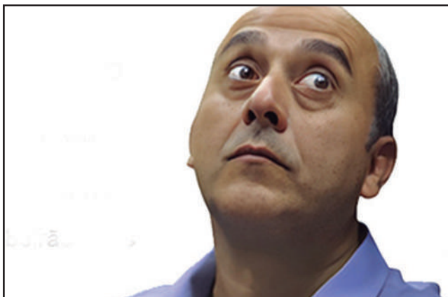
Guto Volpi tem bloqueado munícipes nas redes sociais.

O Prefeito de Ribeirão Pires, Guto Volpi (PL), e seu vice Rubão estão bloqueando moradores da cidade que não concordem com seu governo ou que façam críticas ou até questionamentos mais incisivos nas redes sociais.