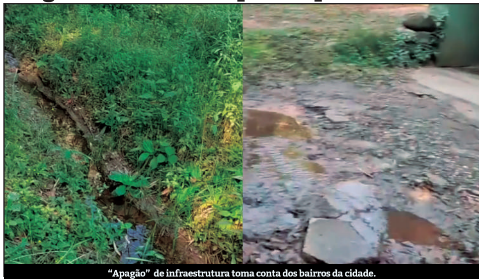
“Apagão” de infraestrutura toma conta dos bairros da cidade.

Uma moradora da rua Clevelândia, no Pilar Velho, procurou o DiárioRP para reclamar sobre um vazamento de esgoto a céu aberto em seu bairro. Ela alega que a Sabesp e a Prefeitura da cidade foram acionadas, mas só resolvem os problemas em frente às residên-