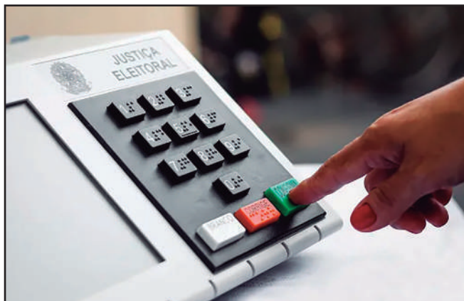
Eleições acontecem no próximo mês.

Os candidatos a prefeitura de Ribeirão Pires tem feito diversas promessas durante a campanha. O DiárioRP fez uma análise e elencou as principais de cada um: