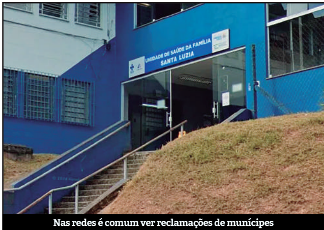
Nas redes é comum ver reclamações de munícipes

Reclamações dos munícipes sobre a Saúde de Ribeirão Pires estão cada vez mais frequentes e está afetando o atendimento na Unidade de Saúde da Família (USF) Santa Luzia. Falta de medicamentos, superlotação e demora no agendamento de exames e até consultas são os principais pontos relatados.