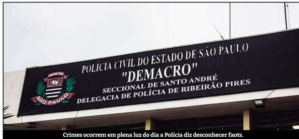
Crimes ocorrem em plena luz do dia a Polícia diz desconhecer fatos.