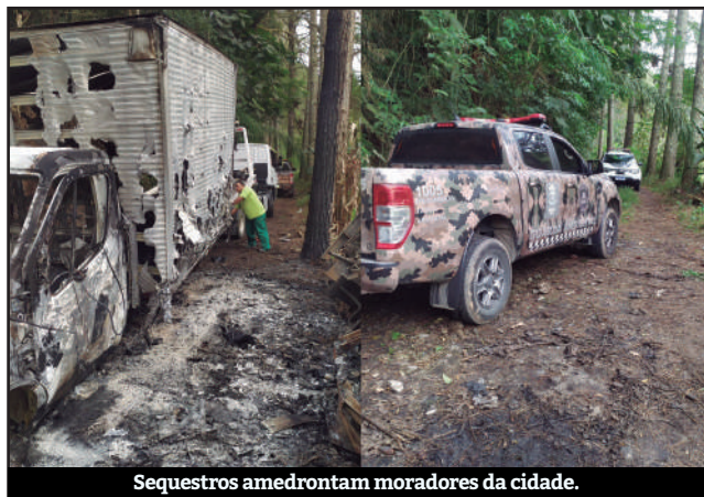
Sequestros amedrontam moradores da cidade.

Somente nesta semana, a região registrou três ocorrências de sequestros. O primeiro caso aconteceu na última quinta-feira (25). O entregador de uma floricultura, que estava acompanhado do pai, foi abordado por dois criminosos enquanto realizava uma entrega na Quarta Divisão. Os homens afirmaram que queriam apenas as