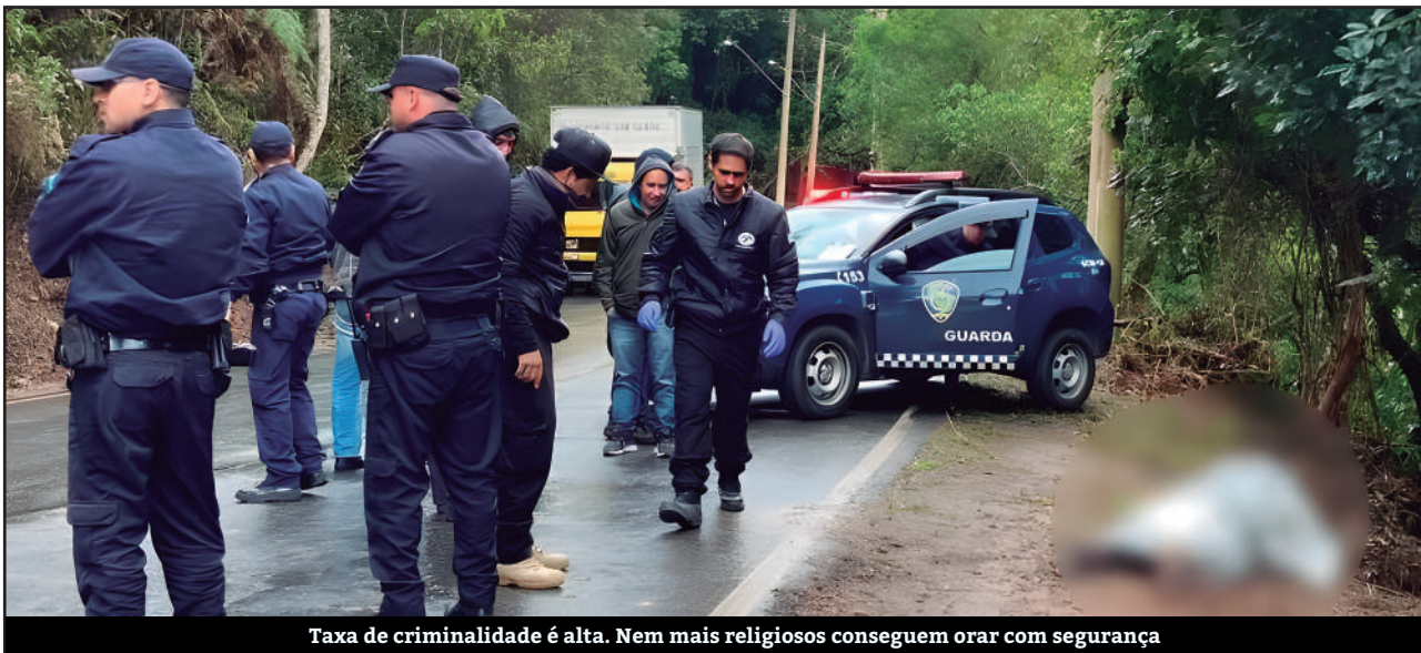
Taxa de criminalidade é alta. Nem mais religiosos conseguem orar com segurança

De acordo com dados da Secretaria de Segurança Pública do Estado de São Paulo (SSP-SP), apenas no primeiro semestre, a cidade já teve o mesmo número de assassinatos que os 12 meses