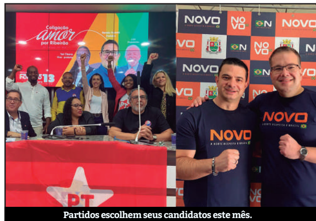
Partidos escolhem seus candidatos este mês.

Os partidos realizam até esta semana as convenções confirmando seus candidatos à prefeitura de Ribeirão Pires, bem como seus vices e os candidatos a vereadores. A última convenção acontecerá no próximo domingo (4). Até o momento, foram realizadas três convenções: Novo, PT e PL. Pelo partido Novo, foram confir-