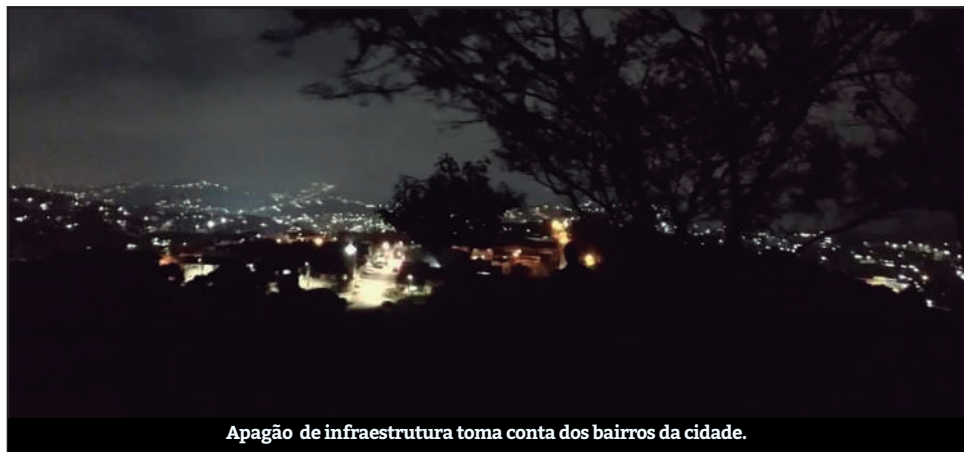
Apagão de infraestrutura toma conta dos bairros da cidade.

Moradores de diversos bairros da cidade reclamam da falta de estrutura que têm.