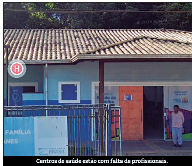
Centros de saúde estão com falta de profissionais.

Moradores de Ribeirão Pires estão reclamando sobre a falta de profissionais nas unidades de saúde da cidade. Um exemplo é a falta de dentista na UBS (Unidade Básica de Saúde) na Quarta Divisão, que está há meses sem atendimento. De acordo com uma publica-