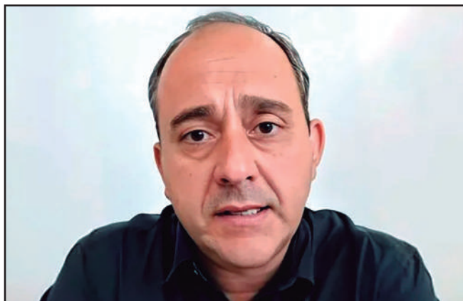
Contas foram rejeitadas pelo Tribunal de Contas do Estado.