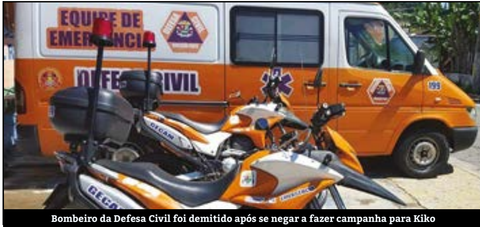
Bombeiro da Defesa Civil foi demitido após se negar a fazer campanha para Kiko

Um bombeiro da Defesa Civil foi demitido por não querer apoiar o atual prefeito de Ribeirão Pires, Kiko Teixeira (PSDB) nas eleições deste ano. As denúncias de assédio moral de gestão de Teixeira são inúmeras. Diversos funcionários públicos já denunciaram que têm sido ameaçados pelos assessores de Kiko por não o apoiar