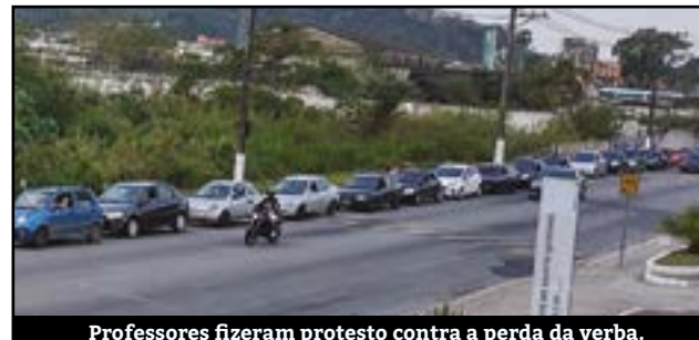
Professores fizeram protesto contra a perda da verba.

Professores da rede municipal de ensino fizeram uma manifestação nesta quarta-feira (30) contra o remanejamento de recursos da Educação em Ribeirão Pires. O ato ocorreu por causa da aprovação do Projeto de Lei Nº 029/2020 realizado pela Câmara na última quinta-feira (24).