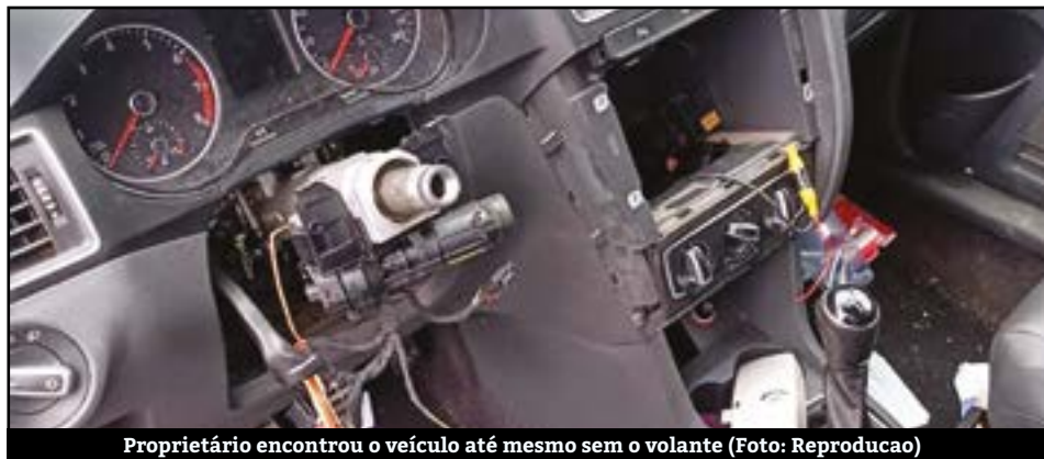
Proprietário encontrou o veículo até mesmo sem o volante

Um morador de Ribeirão Pires teve uma grande surpresa ao ir retirar seu veículo no Pátio Municipal da cidade após o seu carro ser apreendido.