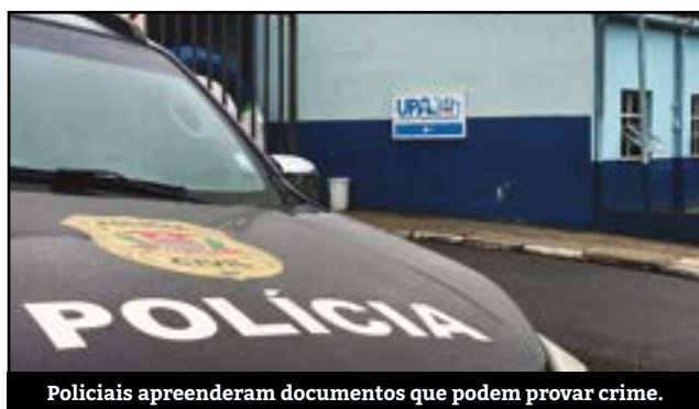
Policiais apreenderam documentos que podem provar crime.

A polícia Civil e o Ministério Público realizaram a Operação "Raio-X" na sede da Secretaria de Saúde de Ri-