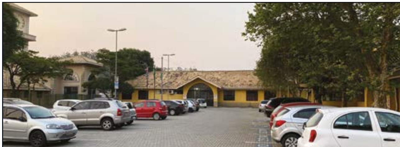
Candidatos a vereadores da base apoiadora de Kiko estão recebendo milhões através de suas empresas.

O Prefeito de Ribeirão Pires, Adler Kiko Teixeira (PSDB), pode estar utilizando, de forma indireta, dinheiro público para fazer campanha política na cidade. A estratégia utilizada por ele é ampliar o Estado de Calamidade pública até dezembro de 2020, assim pode, de forma mais fácil, fazer contratações sem licitação, e contratar empresas de seus candidatos.