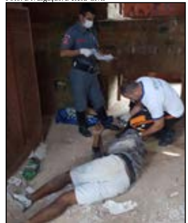
acabou caindo de aproximadamente oito metros de altura. Devido a queda,

ele teve fratura exposta em membros superiores do corpo e lesionou a região pélvica.