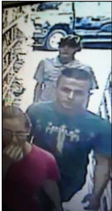
Em ronda realizada pelo Jardim Alvorada e

Jardim Iramaia, já sabendo das possíveis características dos indivíduos, equipes da ROMU acabaram localizando os criminosos. Com eles, foi encontrado o celular de uma das vítimas e revelaram onde a arma, utilizada para roubar a loja, poderia ser encontrada.